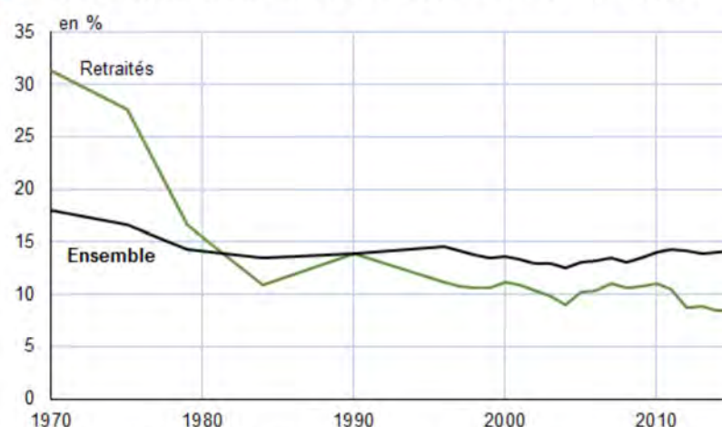
1 Taux de pauvreté des retraités et de la population entre 1970 et 2015